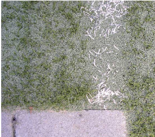
Beispiel Rasen neu mit Granulat befüllt, noch nicht bespielt

Nach der ersten Befüllung muss der Platz eine Zeitlang bespielt werden, damit sich Sand und Granulat im Rasensystem setzen können. Während dieser Zeit kann der Faserüberstand auch geringer sein, als die oben angegebenen Werte.