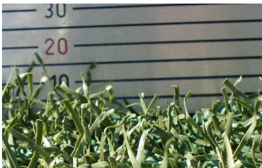
Beispiel Faserüberstand ca. 10-15 mm (ab Oberkante Granulat)

Wichtig ist in diesem Zusammenhang auch die Füllhöhe des Gummigranulats. Die Faserspitzen sollten circa 10 bis 15 mm (im gestreckten Zustand) über das Granulat überstehen. Nur dann ist der Schutz von Spielern und Rasenhalmen optimal gewährleistet.