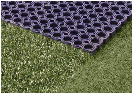
Beispiel Aufstellen der Halme mit Matte

Das Bürsten und Aufstellen der Rasenhalme sorgt dafür, dass die rasenähnlichen Eigenschaften des MiniSpielfeldes erhalten bleiben. Dazu können ebenfalls die obengenannten Besen oder auch eine Abziehmatte (beziebar bei Polytan) genutzt werden. Gleichzeitig mit dem Bürsten und Aufstellen der Rasenhalme wird auch wieder eine Vergleichmäßigung des Granulats bewirkt.